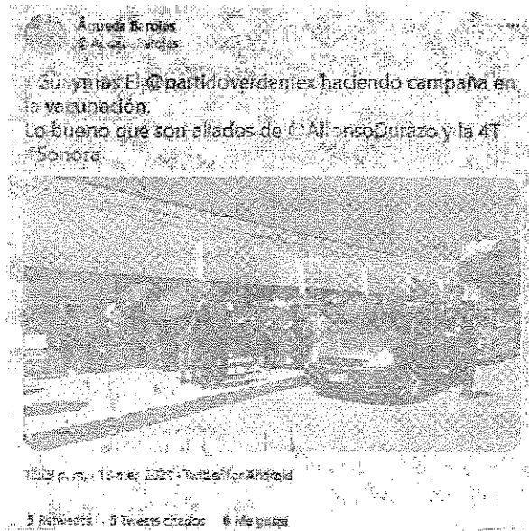
Imagen de la publicación realizada el día 18 de marzo de 2021, en la red social TWITTER, a través del perfil de la ciudadana @AguedaBarojas, donde se puede observar la fila para el programa de vacunación del Gobierno Federal, a las afueras del Plantel CONALEP GUAYMAS y los objetos propagandísticos regalados por el PVEM consistentes en sombrillas.

"1.- Documental Privada. - Consistente en las imágenes de la publicación tomadas de la cuenta pública de la ciudadana de nombre Águeda Barojas de la red social TWITTER, mismas que se insertan a continuación: