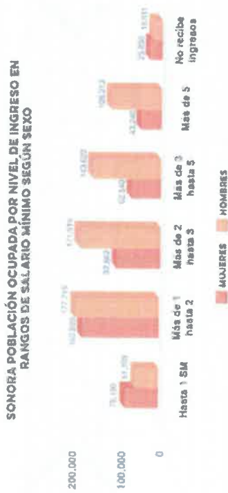
Gráfica: Sonora, población ocupada por nivel de ingreso en rangos de salario mínimo según sexo disponible en el Plan Estatal de Desarrollo Sonora 2021-2027 (p. 80)

El Estado de Derecho es el principio por el cual la población mexicana debe cumplir las leyes y el Estado debe hacerlas cumplir por igual, garantizando legalidad e igualdad. La concepción de Estado de derecho ha evolucionado junto con la historia de los derechos. Mientras que los derechos de primera generación, siendo los derechos civiles y políticos, fueron vinculados a la libertad y a la represión del Estado, los derechos sociales, han sido aparejados a la responsabilidad del Estado en mejorar la calidad de vida de las personas. Sin duda, estos últimos son el gran reto en el cumplimiento de la satisfacción de los derechos dentro de las sociedades latinoamericanas del siglo XXI. Las últimas evoluciones teóricas sobre el derecho, apuntan a la imposibilidad de garantizar un derecho e incumplir otro al mismo tiempo. La indivisibilidad e interdependencia de los derechos significan que, por ejemplo, el derecho a la salud se encuentra vinculado al derecho a la libertad, porque sin la capacidad de mantenerse sano, no hay forma de gozar de libertad.