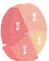
Gráfica de Categorías de retos aprendientes del foro sectorial de infraestructura

Durante las etapas de integración de información para las propuestas locales a través de formulario y mesas de trabajo regionales se identificaron problemáticas que implican el ejercicio de derechos tales como movilidad y acceso a servicios básicos. Esto ha correspondido con diagnósticos en la materia incluidos en el Plan Estatal de Desarrollo 2021-2027 del Gobierno de Sonora 2 , donde se destacan las prioridades en infraestructura, como la recuperación y mejora de los servicios básicos en los municipios y zonas metropolitanas principales del estado mediante el rescate y la rehabilitación de la infraestructura para la gestión de residuos sólidos y la gestión hídrica. Además, se busca aumentar la oferta de espacios públicos que ofrezcan servicios recreativos, culturales, deportivos y ambientales en áreas urbanas del estado. Adicionalmente, se pretende mejorar la coordinación entre instituciones para optimizar la planificación municipal y también abordar la rehabilitación y mejora de la infraestructura educativa, especialmente en el contexto de la pandemia. Véase la Gráfica de Categorías de retos aprendientes del sector obtenidos del foro sectorial de infraestructura