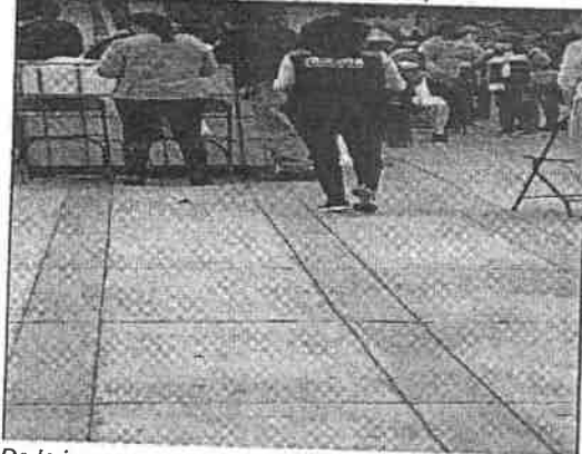
De la imagen que deriva de la videograbacion, se puede observar a una de las dos personas del sexo femenino, quienes se encuentran en las filas de espera de la campaña de vacunacion, portando indumentaria de color guinda, color que es distintivo del partido politico MORENA, asi como logotipos e insignias del citado partido politico.