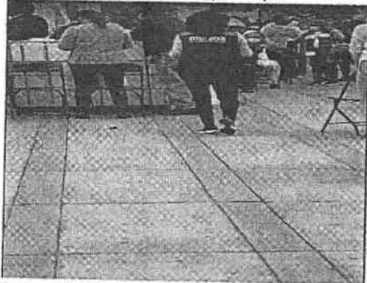
De la imagen que deriva de la videograbacion, se puede observar a una de las dos personas del sexo femenino, quienes se encuentran en las filas de espera de la campaña de vacunacion, portando indumentaria de color guinda, color que es distintivo del partido politico MORENA, asi como logotipos e insignias del citado partido politico.