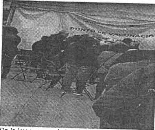
De la imagen que deriva de la videograbacion, se puede observar una manta con las leyendas "GOBIERNO DE MEXICO", asi como "SONORA" y el de "PUNTO DE VACUNACIÓN".