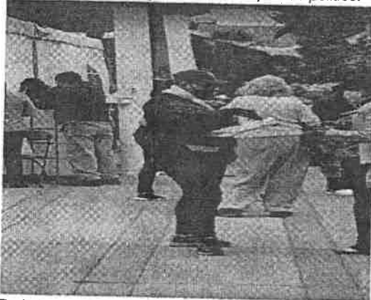
De la imagen que deriva de la videograbacion, se puede observar a una de las dos personas del sexo femenino, quienes se encuentran en las filas de espera de la campaña de vacunacion, portando indumentaria de color guinda, color que es distintivo del partido politico MORENA, asi como logotipos e insignias del citado partido politico, haciendo cuestionamientos, asi como recolectando datos de una persona del sexo femenino y de edad avanzada. Se estima que lo antes denunciado y de manera gráfica expuesto en el video que se ofrece como prueba documental técnica y de donde se obtuvo las fotografías insertadas anteriormente, con el propósito de dejar constancia de la ilegal conducta desplegada por el partido politico