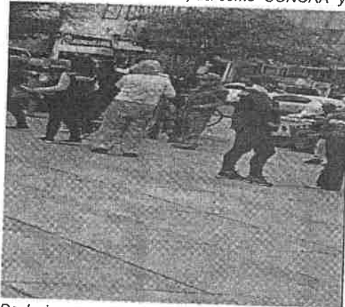
De la imagen que deriva de la videograbacion, se puede observar dos personas del sexo femenino, quienes se encuentran en las filas de espera de la campaña de vacunacion, portando indumentaria de color guinda, color que es distintivo del partido politico MORENA, asi como logotipos e insignias del citado partido politico.