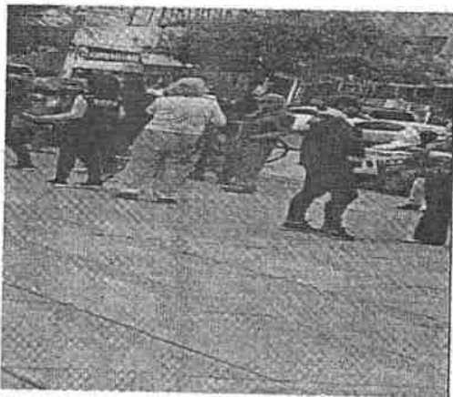
De la imagen que deriva de la videograbacion, se puede observar dos personas del sexo femenino, quienes se encuentran en las filas de espera de la campaña de vacunacion, portando indumentaria de color guinda, color que es distintivo del partido politico MORENA, asi como logotipos e insignias del citado partido politico.