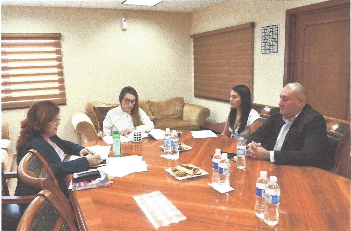
Cuadro No. 14