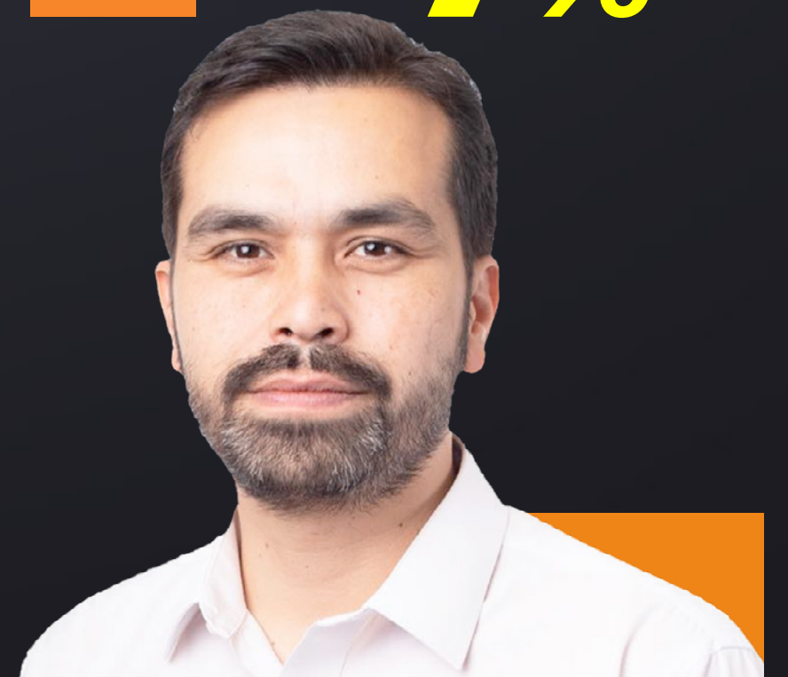
Jorge Álvarez MÁYNEZ