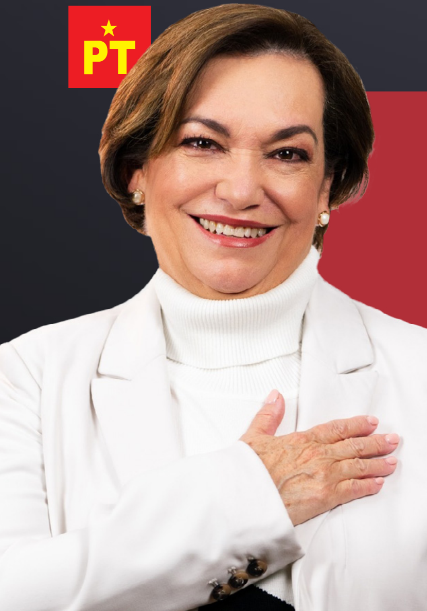
María Dolores Del Río