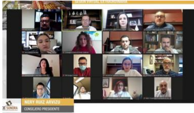
Evidencia fotográfica de difusión.