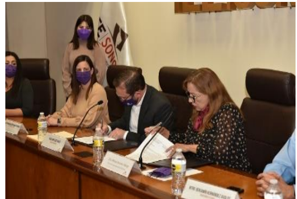
Firma de convenio entre la Fiscalía de Delitos Electorales del estado de Sonora, el Tribunal Estatal Electoral de Sonora y el Instituto Estatal Electoral y de Participación Ciudadana de Sonora.