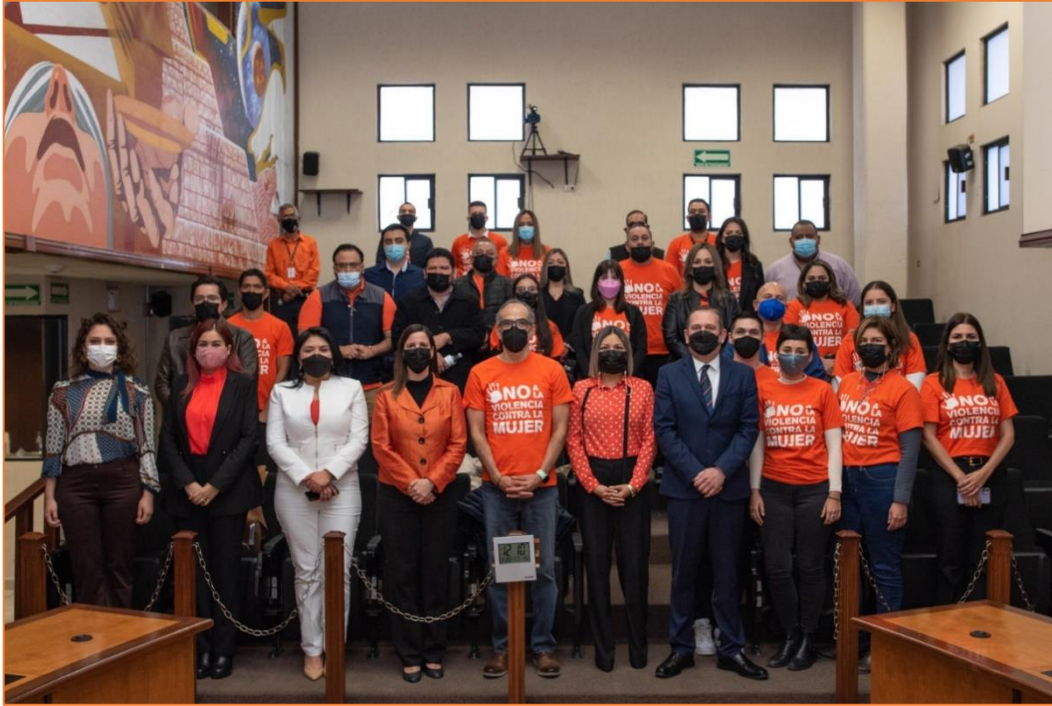
Firma de convenio entre el IEEyPC y el Instituto Sonorense de las Mujeres.