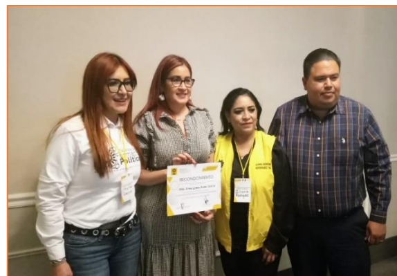
Difusión en las redes sociales de la adhesión del Instituto Estatal Electoral y de Participación Ciudadana de Sonora a la Red Nacional y Estatal de Mujeres Electas.