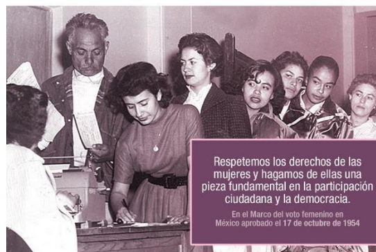
Comisión de Paridad e Igualdad de Género